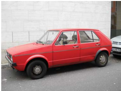
Abb. 3 Designsprachen des VW Golf I, III, VI

Auch die Formen haben sich seit der Einführung der Postmoderne Ende der 1970er Jahre und zu Beginn der 1980er Jahre stark verändert. In den 1950er und 1960er Jahren ist das Formdesign der Alltagsgegenstände eher eckig und geometrisch gewesen. Seit der Postmoderne ist es eckig und rund, wobei dies vor allem auf das deutsche Design zutraf. Andere Länder hatten schon früher ein organischeres Design und auch im deutschen Jugendstil gab es mehr florale, geschwungene und ovale Formen. Allerdings muss man dazu sagen, dass der Jugendstil eine Bewegung des Kunsthandwerks und von daher keine Massenbewegung war. Heute ist das Design eher geschwungen. Es ist sehr viel abstrakter, emotionaler, natürlicher und einfacher als früher. Denn die Formgebung des Designs von früher war eher an unnatürlichen Formen angelehnt. Dies trifft vor allem auf die 1960er und 1970er Jahre und auf das Design der „Guten Form“ zu. Die Formen waren meist eckig und geometrisch.