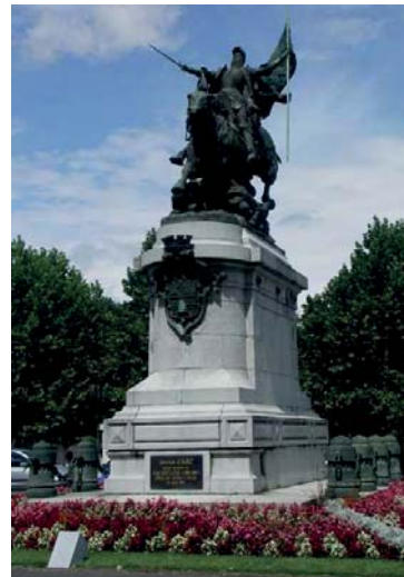
Reiterdenkmal der Jungfrau von Orléans in Chinon, einem von unzähligen in Frankreich

Vergessen dürfen wir auch nicht die Auseinandersetzungen zwischen beiden Reichen im französischen Siedlungsgebiet in Kanada (Quebec 17. Jhd. z. B.), im amerikanischen Unabhängigkeitskrieg Ende des 18. Jhd. (Frankreich stand auf Seiten der Aufständischen, also gegen das Vereinigte Königreich) oder die napoleonischen Kriege, die mit Napoleons Niederlage in Waterloo 1815 endeten, ebenfalls ein für das franz. Nationalgefühl traumatisches Ergebnis. Fast völlig vergessen ist die Faschoda-Krise (1898), in der beide Staaten wegen eines winzigen Dorfes im heutigen Sudan am Rande eines Krieges standen, typisch für den Wettlauf nach Afrika in