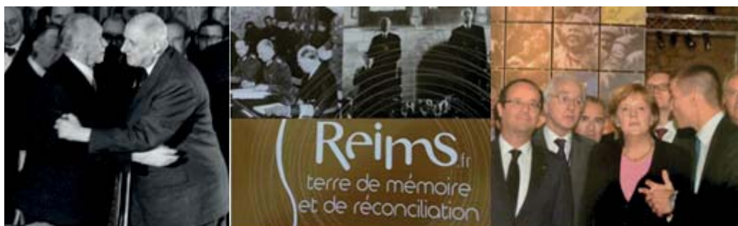
Die berühmte Accolade in der Kathedrale in Reims (08.07.1962)

Begünstigt wurde der Abschluss des Elysée-Vertrags auch durch die ersten Fortschritte in der europäischen Einigungspolitik, insbesondere durch die Gründung der Montanunion. Sie wurde konzipiert von zwei ebenfalls außergewöhnlichen Politikern: Jean Monnet und Robert Schumann. Es ging darum, mögliche Kriege zu verhindern, indem kriegswichtige Industrien auf der Basis von Kohle und Stahl einer gemeinsamen Verfügungsgewalt übertragen wurden, der Montanunion, der Europäischen Gemeinschaft für Kohle und Stahl, der neben Frankreich und Deutschland auch Italien und die Benelux-Staaten sich anschlossen (1951). Dies war ein kluger Schachzug gegen Revanchisten und mögliche Kriegstreiber, war auch ein erster Schritt auf dem Wege zur EWG, EG und schließlich zur EU, was heute vielfach gar nicht mehr bekannt oder bewusst ist, damals aber durchaus epochal war.