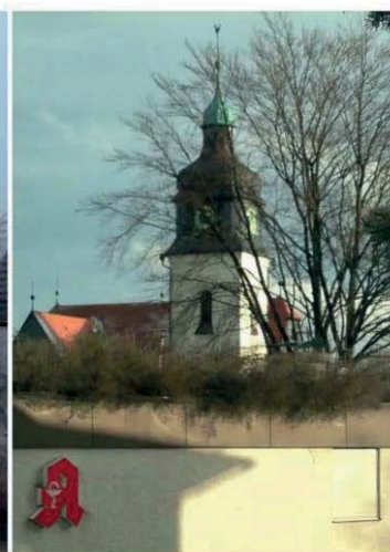
Sonnenschein am 15. 12. 2013