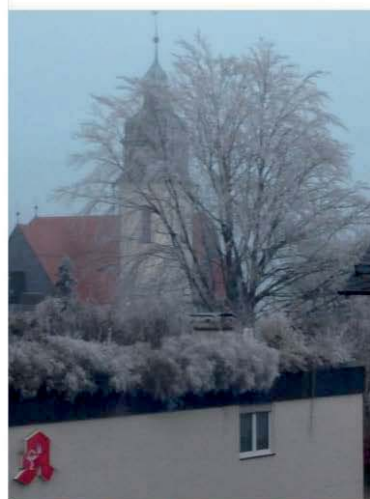
Raureif am 14. 12. 2013