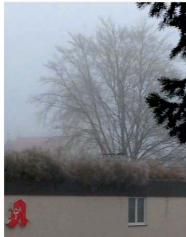
Nebel am 13. 12. 2013