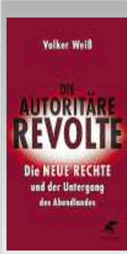
Volker Weiß, „Die autoritäre Revolte. Die Neue Rechte und der Untergang des Abendlandes“, Verlag Klett-Cotta, Stuttgart 2017, gebunden, 304 Seiten, 20,60 Euro

Schwarz-Weiß-Tönen gezeichnet werden sollten. Das Werk ist ein durchaus kenntnisreiches Buch über Geschichte und Entwicklung der politischen Rechten in Deutschland. Das Problem des Autors besteht nicht primär darin, dass er dies aus einer abgehobenen, linksintellektuellen Position heraus geschrieben hat – der Zeit-Autor Ijoma Mangold bescheinigt ihm sogar einen Ton der Betulich-