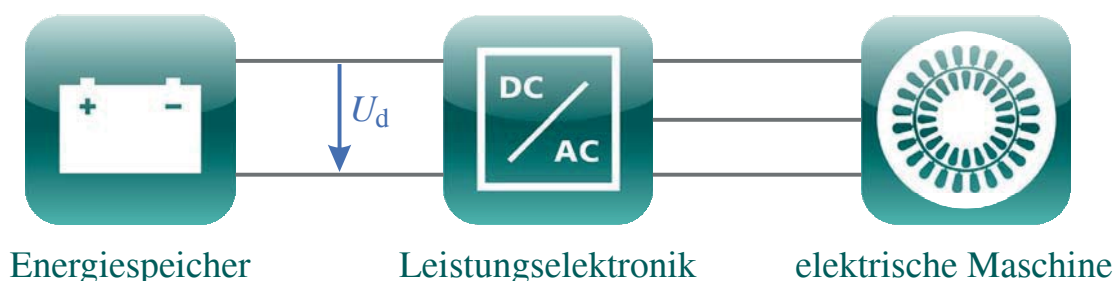
Abbildung 1.1: Prinzipdarstellung des elektrischen Antriebsstrangs in einem Kraftfahrzeug

Der PWR verbindet die DC- mit der Wechselstrom (AC)-Seite. Die Transformation von Gleichspannung zum Drehstromsystem erfolgt über Pulsdauermodulation (PDM). Aus diesem Grund sendet die LE leitungsgebundene HF-Störsignale aus. Dadurch stellt diese die sogenannte Störquelle aus Sicht der EMV dar. Die galvanische Übertragung der jeweiligen Störungen erfolgt über die Hochvoltlei-