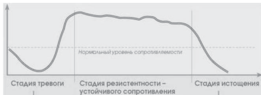
Рисунок 2. Модель генерализованного адаптационного синдрома Г. Селье 3

Ганс Г. Селье (родился в 1907 в Вене, умер в 1982 в Монреале) дал в 1936 в своей первой научной работе определение понятию "стресс" и основал свою школу по изучению адаптационного синдрома обусловленных стрессом реакций организма. Его важнейшие научные труды: "Введение в учение об адаптационном синдроме" (1953), "Стресс захватил нашу жизнь" (1957), "Гормоны и резистентность" (1971), "Стресс без дистресса" (1974). Его труд "Стресс моей жизни" (1979) был переведен на 17 языков. В 1979 Г. Г. Селье совместно с А. Тоффлером основывает институт стресса в Канаде.