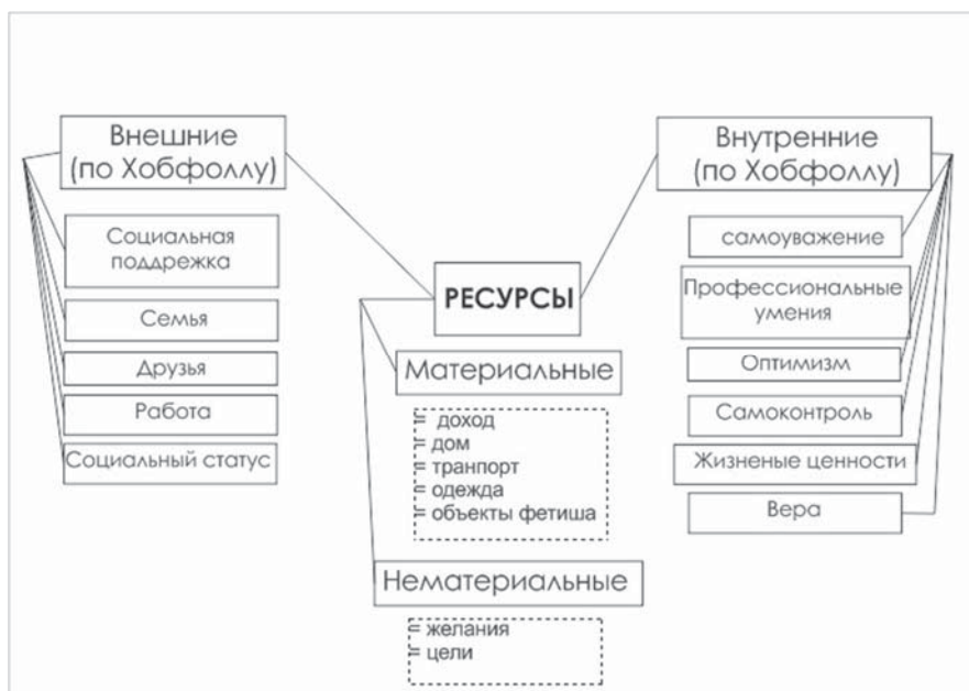
Рисунок 4. Теория сохранения ресурсов С. Хобфолла (1996) 5

Человек всегда стремится к сохранению, созданию и защите своих ресурсов, на приобретение и сохранение ресурсов оказывают влияние критические жизненные события и повседневные, небольшие стрессоры.