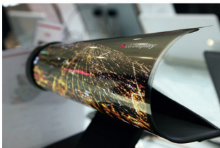
Abbildung 1.1: Prototyp eines rollbaren 18-Zoll-OLED-Displays, vorgestellt von LG auf der CES2016 [12].

den Markt gebracht, was bewirken könnte, dass die OLED-Technologie für den Verbraucher günstiger wird. Eine stärkere Verbreitung der OLED-Technik wird aktuell vor allem durch die hohen Produktionskosten verhindert. Nach Einschätzung der Fa. Merck KGaA wird der Preis für OLED-Fernseher auch auf Dauer stets höher sein als bei LCD-Fernsehern [22]. Über die üblichen Faktoren hinaus, die bei der Markteinführung neuer Technologien eine Rolle spielen, sind viele der notwendigen organischen Materialien zudem außerordentlich teuer. Damit die OLED in der Beleuchtungstechnik gegen die LED konkurrieren kann, muss die Weißlichteffizienz größer als 100 \text{ lm/W} betragen, gleichzeitig darf der Preis nicht höher als 1 \text{ ct/lm} sein [23].