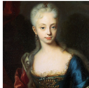
Erzherzogin Maria-Theresia, hier noch sehr jung, musste heiraten, damit der Kaisertitel in der Familie Habsburg bleiben konnte.