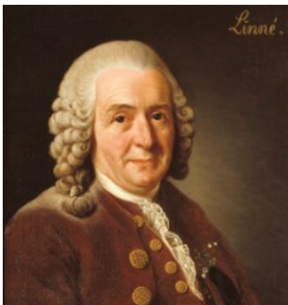
Carl Linné hat mit der Systema naturae die heutige Nomenklatur begründet. © nach einem Porträt von A. Roslin, gemeinfrei

Carls Leben ist in allen Details untersucht und beschrieben, die Literatur überwältigt mich schon in der bloßen Annäherung und sie ist zum 300. Geburtstags noch einmal angewachsen. Auf Deutsch bieten sich die