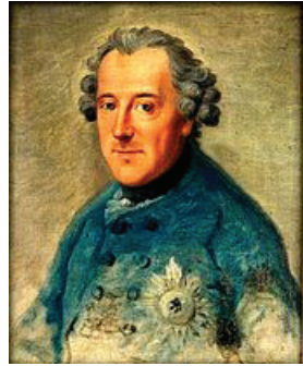
Friedrich II. von Hohenzollern war Kurfürst von Brandenburg und König von Preußen.

1740 betritt Maria-Theresia die politische Bühne und wird von Friedrich II. für schwach genug gehalten, Schlesien noch im Winter 1740/41 anzugreifen.