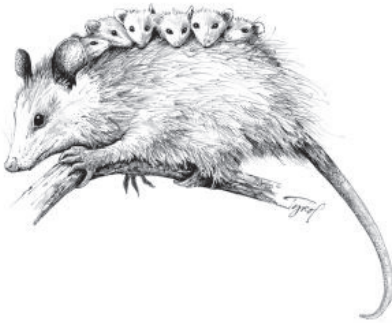
Opossum ( Didelphis marsupialis) mit Jungen auf dem Rücken. So lassen sie sich gerne befördern, wenn sie den Beutel verlassen haben.

Wie erwähnt beginnt Linné seine acht Ordnungen mit den Primates und dem Menschen. Damit sind Homo und Homo sapiens schon mal abgehandelt.