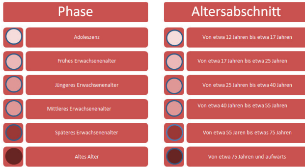
Abbildung 3: Alterskategorisierung der Entwicklungsphasen (eigene Darstellung in Anlehnung an Cockerham 1991: 11)

Die Anzahl der Klassen bei Cockerham (1991) zeigt, dass beim Erwachsenenalter die Lebensjahr-Abstände im Gegensatz zu Gerrig (2015) deutlich anders und sogar verkürzt sind. Ähnlich schlägt auch Armstrong (2013) eine detailliertere Differenzierung der verschiedenen Lebensphasen vor. Im Gegensatz zu Cockerham (1991) verlängert er die Lebensphasen allerdings weiter nach hinten, was ebenfalls der allgemeinen Altersentwicklung in Deutschland entspricht, wie es in Abbildung 4 zu sehen ist.