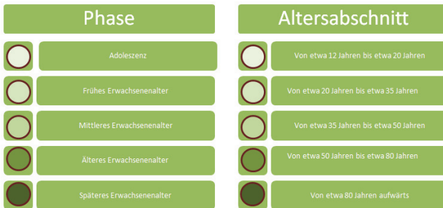
Abbildung 4: Alterskategorisierung der Entwicklungsphasen (eigene Darstellung in Anlehnung an Armstrong 2013)

Die Anzahl der Klassen bei Cockerham (1991) zeigt, dass beim Erwachsenenalter die Lebensjahr-Abstände im Gegensatz zu Gerrig (2015) deutlich anders und sogar verkürzt sind. Ähnlich schlägt auch Armstrong (2013) eine detailliertere Differenzierung der verschiedenen Lebensphasen vor. Im Gegensatz zu Cockerham (1991) verlängert er die Lebensphasen allerdings weiter nach hinten, was ebenfalls der allgemeinen Altersentwicklung in Deutschland entspricht, wie es in Abbildung 4 zu sehen ist.