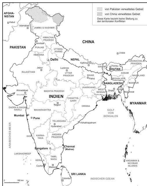
Abbildung 1: Landkarte von Indien