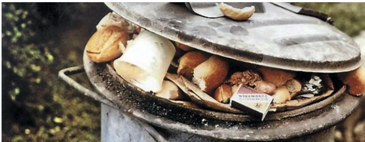
Abbildung 2.3: Speckitonne für die Schweinemast mit Störstoffen

Ein Rückblick in die Geschichte zeigt, dass die Verwendung organischer Abfälle zur Bodenverbesserung und Düngung schon lange von Menschen praktiziert worden ist. Daraus leitet sich ja auch die Flächenkompostierung im biologischen Landbau ab. Die an der Bodenoberfläche ablaufenden aeroben Prozesse wurden erst viel später durch die Umsetzung der Biomasse in Mieten intensiviert und der so hergestellte organische Dünger konnte gezielt im Pflanzenbau eingesetzt werden. Das war der Ursprung der heute praktizierten Kompostierung. Auch die Getrenntsammlung von Abfällen für die unterschiedlichsten Verwendungen gibt es schon sehr lange. Kompostierung und Getrenntsammlung ist daher wohl ein ziemlicher alter Hut. Erhebend ist, dass wir Getrenntsammler und Kompostierer mit großen Namen in Verbindung stehen – zumindest zeitversetzt.