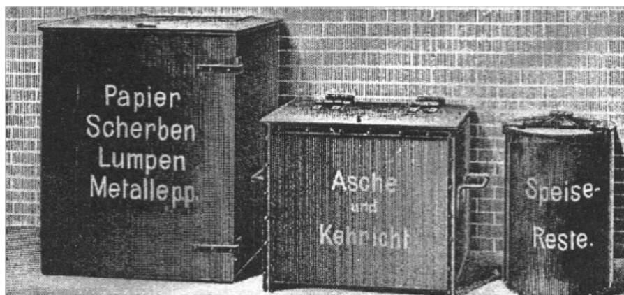
Abbildung 2.1: Dreiteilungssystem – Küchensammelgefäß mit Wandhalterung für Speisereste und gewerbliche Abfälle (Fodor, 1911)

In Deutschland wird 1907 von der Getrenntsammlung nach dem Dreiteilungssystem berichtet (Breer et al., 2010). Im Zentralblatt für das gesamte kommunale Reinigungswesen Nr. 4 aus dem Jahr 1911 wird auf das um das Jahr 1910 eingeführte „System der Dreiteilung“ in Charlottenburg hingewiesen (Die Städtereinigung, 1911): „Dort müssen Speisereste und Küchenabfälle, Müll und Kehricht und schließlich die Sperrstoffe (Papier, Lumpen, Glas, Metallteile etc.) getrennt gesammelt werden. Letztere werden sortiert und verkauft. Die ersteren werden verfüttert in einer der Müllabfuhrsgesellschaft gehörigen Schweinemästerei. Vergleichbare Projekte gab es auch in Skandinavien und den USA (Breer et al., 2010). Diese Systeme hatten allerdings eine vergleichsweise kurze Halbwertszeit. Maßgeblich verantwortlich hierfür waren ökonomische Probleme in Verbindung mit zunehmenden Absatzschwierigkeiten für die organischen Abfälle als Dünger oder Futtermittel.