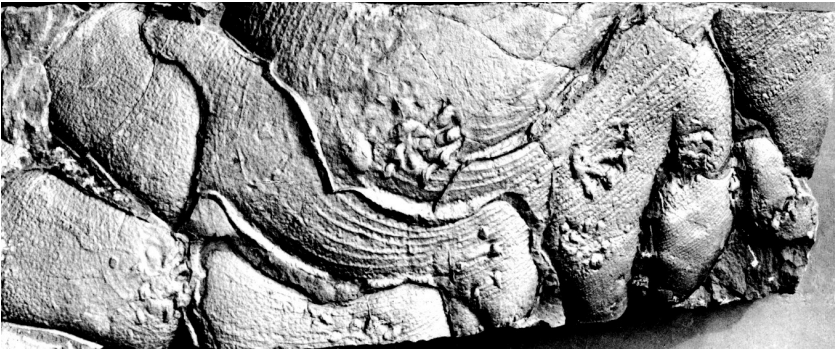
Abb. 1. Fährtenplatte, Gotha Nr. 1394, heute im Bestand der Sammlung des Phyletischen Museums Jena, nach Pabst (1908): „ausgetrocknete Wasserlache...zahlreiche Wellenfurchen“, Foto Arch. MNG.

PABST (1908) hat sich während seiner Tätigkeit am Herzoglichen Museum Gotha (1890 bis 1908) vorwiegend mit der Paläontologie von Tetrapodenfährten, insbesondere mit der Fundstätte am Bromacker (Tambach Formation) beschäftigt. Sicher ist es seinem umfangreichen meteorologischen Wissen zu verdanken (MARTENS 1994, PABST 1904), dass er auch die Entstehung der fossilen Netzleisten auf den Fährtenplatten erstmals richtig deuten konnte. In seiner zusammenfassenden Arbeit von 1908 bezeichnete Pabst Netzleisten als „reliefartige Wulste“ und als „klassisches Beispiel“ für die Erklärung dieser fossilen Erscheinung in Gesteinen als ehemalige Trockenrisse. Auf der Fährtenplatte Gotha Nr. 1394 (heute im Bestand der Sammlung des Phyletischen Museums Jena) erkannte er eine ausgetrocknete Wasserlache und das sich auf ihr neben Regentropfenabdrücken zahlreiche „Wellenfurchen“ befinden.