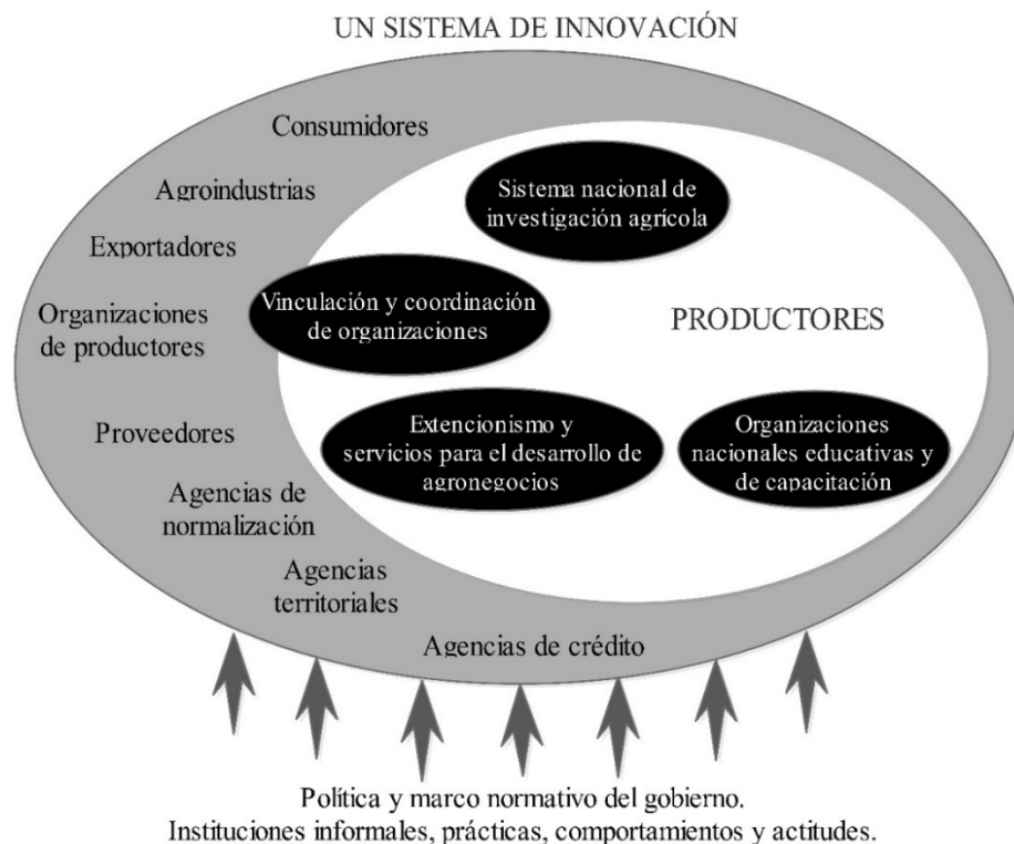
Figura 2. Sistema de innovación agrícola (IICA, 2017).

La innovación agrícola surge de la acción colectiva, de la coordinación y del intercambio de conocimiento entre diversos actores (Figura 2), tiene un papel fundamental y permite alcanzar una agricultura más sostenible. Para el desarrollo agrícola es necesario una buena capacidad de adaptación y respuesta a los eventos que generan duda en los precios de los mercados y problemas relacionados con el cambio climático. Además, se incluyen aspectos como el avance tecnológico y la transformación institucional, así como el papel del Estado, el sector privado y la sociedad civil (IICA, 2017).