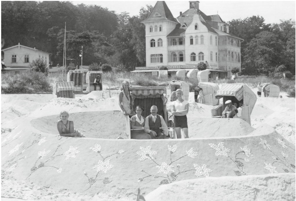
Beim Strandburgen-Wettbewerb in Binz gewannen wir einen großen Pralinenkasten.