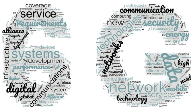
Abbildung 1.2: Wortwolke der drei White Paper aus China [42], der USA [47] und Europa [51].

lungen der physikalischen Schicht ergibt sich ein erheblicher Forschungsbedarf in den höheren Schichten, wie beispielsweise rund um den Themenblock der Netzwerktechnik, wie den Entwurf von Netzwerken von Netzwerken, also sub-Netzwerken oder Campusnetze, um auch hier nur ein paar Stellvertreter zu nennen. Der Fokus der vorliegenden Arbeit liegt jedoch ausschließlich auf der untersten, der physikalischen Schicht und umfasst neben der Kommunikationstechnik ebenso die Radartechnik. Gleichzeitig wird der mmWellen-Funkkanal adressiert, die Antennentechnologie thematisiert und darauf basierend die Qualität des Radars als auch der Kommunikation unter Diskussion der geteilten Wellenform des zukünftigen JCRS-Systems evaluiert. Der Systementwurf fokussiert sich dabei auf kombinierte Kommunikations- und Radarsysteme für den Automobilbereich.