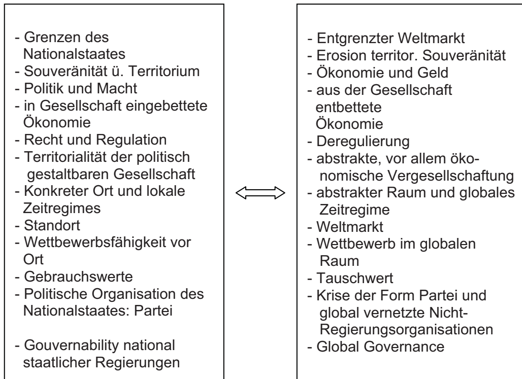
Abbildung 2: Die zwei Seiten der Globalisierung

Die linke Seite beschreibt die lokale Bindung, die konkrete, soziale Dimension wirtschaftlicher, sozialer und politischer Prozesse. Die rechte Seite zeigt die abstrakte Seite globaler Prozesse. Dialektisch gesehen sind beide Seiten keine Gegensätze, sondern Kehrseiten der selben Münze. Daher ist es auch zu verstehen, warum die Globalisierung insgesamt sehr unterschiedlich bewertet wird. Für viele Menschen und Staaten ist es eine Chance und für andere eine konkrete Bedrohung, es gibt Gewinner und Verlierer. 13 Globalisierungskritiker fassen Ihre Skepsis in die plastischen Slogans: ‚Die Welt ist kein Ware‘ und ‚Globalisierung hat kein menschliches Gesicht‘. Sie kämpfen gegen die aus ihrer Sicht neoliberale Ideologie einer ökonomischen Globalisierung ohne Legitimation. Sie verlangen u. a. eine gerechtere Verteilung der weltweiten Güterproduktion, faire Handelsbedingungen, eine Demokratisierung und Transparenz der Entscheidungen in der internationalen Politik um dadurch auch die globale Sicherheit zu erhöhen. Nicht wenige verlangen eine De-Globalisierung oder eine sozialistische Alternative. 14