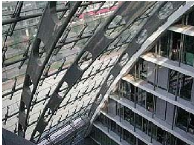
Abbildung 1.1: Glas-Doppel-Fassade am Berliner Bogen, Hamburg

Die Gebäudehülle ist prägend für das Erscheinungsbild eines Bauwerks, und zwar sowohl hinsichtlich seiner Optik bzw. architektonischen Gestaltung als auch hinsichtlich seiner bauphysikalischen Eigenschaften. Seit Ende des 20. Jahrhunderts werden technisch hoch beanspruchte Gebäudehüllen, beispielsweise von modernen Büro- und Hochhäusern oder bei Gebäudesanierungen, zusehends mehrschichtig ausgebildet. Eine Möglichkeit der mehrschichtigen Fassade ist der Typ der Glas-Doppel-Fassade, bei der der raumabschließenden Fassade in einem gewissen Abstand noch eine zweite Fassadenebene vorgelagert ist. Dadurch entsteht ein luftdurchströmter Fassadenzwischenraum, der je nach Gestaltung und Funktion wenige Zentimeter, aber auch über einen Meter betragen kann. Ein Hauptgrund für den Aufstieg der Glas-Doppel-Fassade ist sicherlich der Wunsch von Architekten und Bauherrn nach mehr Transparenz und natürlichem Tageslicht.