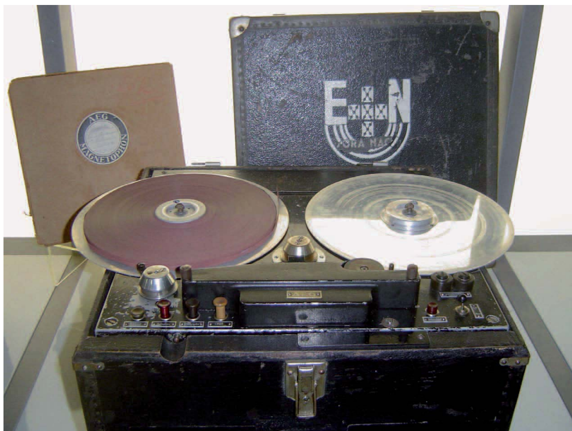
Abb. 1: Armando Leças Magnetophon Koffergerät Modell K-4 (hier ohne Lautsprecher und Verstärkereinheit), Seriennummer 1260.