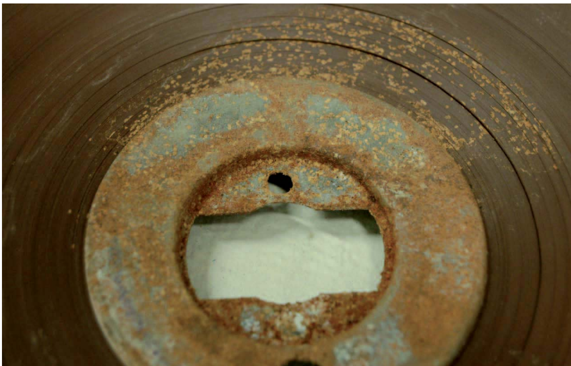
Abb. 5: Durch Wasserschaden korrodierte Ablagerungen an Wickelkern und Tonband.

Die Bänder zeigten, trotz ihres teilweise schon bedenklich gealterten Zustandes, bei der Übertragung eine zum Teil erstaunlich gute Signalqualität und konnten vollständig und ohne Ausfälle digitalisiert werden. Einige wenige Bänder hatten während ihrer Lagerungsgeschichte unter einem Wasserschaden gelitten und waren entsprechend stark in Mitleidenschaft gezogen worden. Abb. 5 zeigt eines dieser Bänder: Es mussten die korrodierten und dadurch stark verklebten Stellen aufwendig gereinigt und die einzelnen Lagen manuell voneinander getrennt werden.