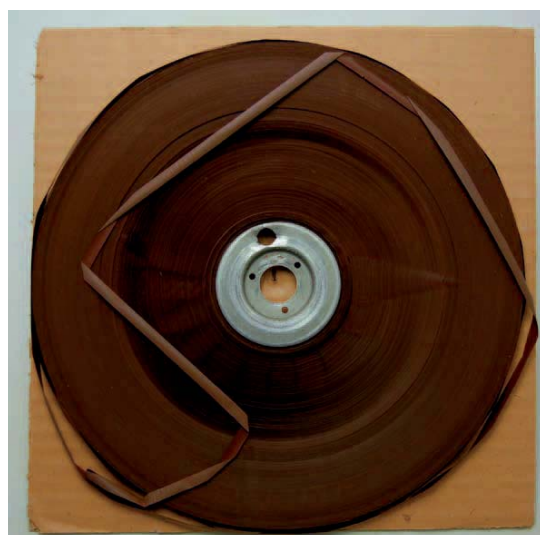
Abb. 2 (linke Seite) und 3 (rechte Seite): Typisches Band der Sammlung Armando Leça. Links die Tonbandschachtel und rechts das Tonband im Originalzustand (Schäden durch Vinegar-Syndrom und Versprödung sind bereits sichtbar).